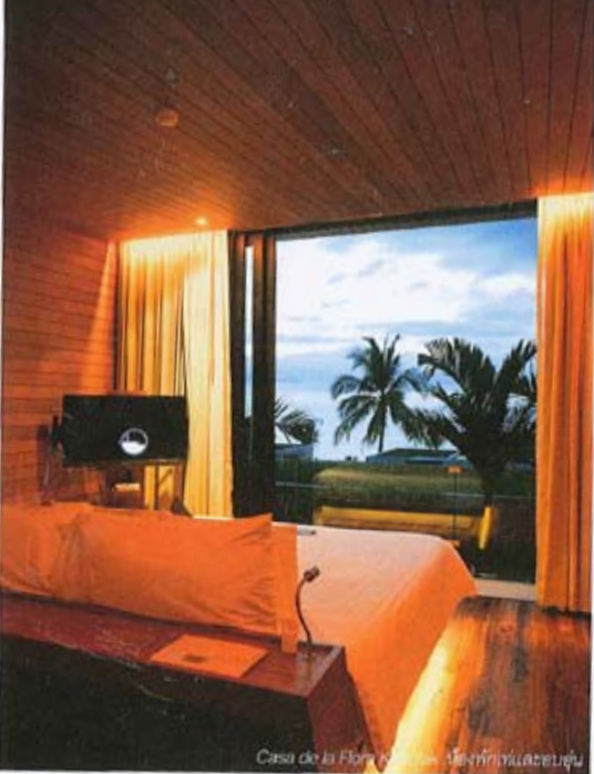
Casa de la Flora Hotel, เมืองพัทลุงและสุราษฎร์ธานี

สายหน่ยนักท่องเที่ยวนิยมศึกษ จากเกาะที่ควรรองรับนักท่องเที่ยวได้ 250 คนต่อวัน แต่การควบคุมทำได้ยากยิ่ง เราจึงได้ข่าวว่านักท่องเที่ยวนัก บางวันอัดแน่นมากถึง 1,000 คน น้ำตกใจเหลือเกิน เกาะที่มีพื้นที่ขนาด 15 ตร.กม. แต่ต้องรองรับคนจำนวนมหาศาลขนาดนั้น โกล้ถึงยกความ สบเต็มหายไป โกล้จากหัวหินๆ ส่งเสียงเอ็นเตอร์เทนลูกทัวร์ไทยเต็มที่ หากเปรียบกับเกาะศายเป็นบ้านของสาวงามละอ่อนที่หัวกระไดไม่เคยแห้ง เราคิดว่า สาวน้อยนางนี้กำลังบอบช้ำทั้งร่างกายและจิตใจจากการรับแขก มากเกินไปแล้ว