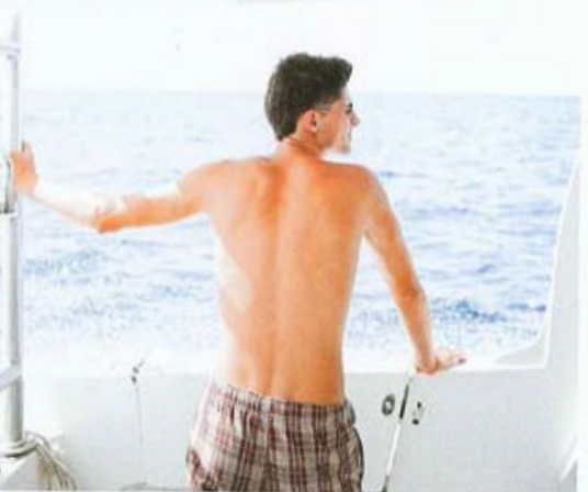
หาดทรนถา