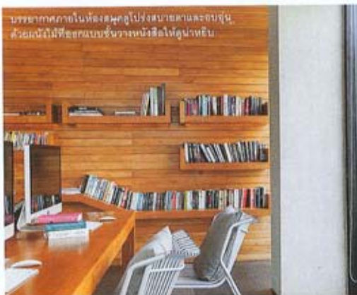
บรรยากาศภายในห้องสมุดถูกไปฝั่งสนามและที่รับ ด้วยผนังไม้ที่ออกแบบขึ้นวางนั้งคือโต๊ะพนัก