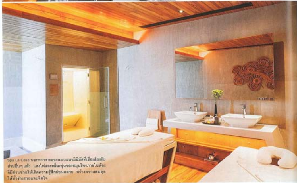
Spa La Casa นอกจากการออกแบบแบบมินิมัลที่เชื่อมโยงกับ ส่วนอื่นๆ แล้ว แสงไฟและกลิ่นกำมะถันในอากาศในห้อง ก็มีส่วนช่วยให้เกิดความรู้สึกผ่อนคลาย สร้างความสมดุล ให้ทั้งร่างกายและจิตใจ

ให้แขกได้สัมผัสพร้อมกับอาหารไทยและนานาชาติ รวมถึงอาหารฟิวชั่นสไตล์ออร์แกนิก ด้านหน้าห้อง อาหารมีลานสนามหญ้ากว้างสำหรับให้แขกได้นั่ง รับประพลาอาหารเคล้าเสียงคลื่นและบรรยากาศ ยามเย็นที่ตรงอาทิตย์ใกล้หลังน้ำ ลีทที่บนเทอร์เรซ ชั้นสองยังเหมาะกับการสังสรรค์หรือนั่งชมวิวทะเล แบบพาณธรรมา นอกจากนี้ฝั่งตรงข้ามรีลอร์คยังมี ห้องอาหาร Ingoh ซึ่งใช้คอนเซ็ปต์อิงหมอนขนมฟ้า ให้แขกได้ชมบรรยากาศห้องพิกายาค้าน ซึ่ง ภายในห้องอาหารตกแต่งด้วยแสงไฟที่ฟ้าและมีเก้าอี้ เรืองแสงช่วยสร้างความโดดเด่น