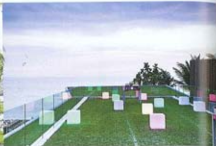
บรรยากาศยามเย็นบนหลังคาห้องอาหาร La Aranya เป็นพื้นที่ซึ่งเหมาะสำหรับสังสรรค์และชมท้องฟ้า และทะเล ด้านข้างเพิ่มความปลอดภัยแบบไม่กระทบ สายตาดูวิวทิวทัศน์จากกระจกเงาสีนิรภัย พื้นปู หญ้าเทียมนุ่มสบายเท้า