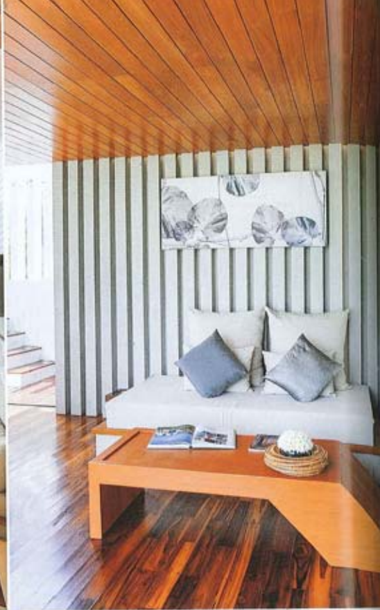
มุมนั่งเล่นในห้อง Casa Pool Suite

เพียงข้ามสะพานจากสนามกอล์ฟที่ถึงจุดหมายของการเดินทางครั้งนี้ Casa de La Flora วิลล่าคันทรีทะเลอันเจียมสงบเลียบหาดบางเนียง เขาหลัก จังหวัดพังงา ด้วยการออกแบบที่ร่วมสมัยดูแตกต่างจากรีสอร์ทอื่นในย่านเดียวกัน ทำให้ที่นี่ดูโดดเด่นตั้งแต่ส่วนโค้งดาดมับที่เรียบโค้งไปรุ่งตา มีงานดีไซน์จากวิศกรธรรมชาติสร้างความน่าสนใจให้ผนังคอนกรีตเปลือย มีการออกแบบอาคารจะเน้นโชว์เนื้อไม้ของวัสดุคอนกรีตและโครงสร้างแนวเรียบเท่ แต่ความหมายของ Casa de La Flora หรือ “บ้านแห่งดอกไม้” กลับดูอ่อนหวาน ชื่อวิลล่าแต่ละหลังตั้งตามชื่อของดอกไม้ที่นำไปใช้งานราชพิธี อีกทั้งตำแหน่งของวิลล่าแต่ละหลังยังให้ความสำคัญทางของคณาภิรมย์นับัญ ด้วย