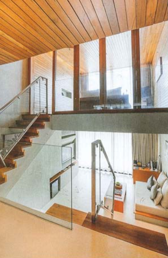
Duplex Grand Pool Villa วิลล่าสองชั้น มีห้องนอนบนชั้นสอง ส่วนชั้นล่างเป็นห้องนั่งเล่น ราวบันไดและราวกันตกเป็นกระจกใสสีทึบ สร้างความโปร่งตาและปลอดภัย