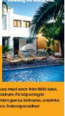
Boothang vid Antinn villa.

Efter de tjugo resoguiderna söker Louis Vuitton nu digitalt med sin app Ambie with Louis Vuitton . Här kan du spara smutstrastalen i staderna du besöker, ladda ner resoguidar och få tips från stjärnor som Sofia Coppola och Sarah Jessica Parker. Färs gratis i AppStore.