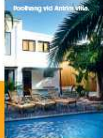
Boothang vid Antrim villa.

Efter de tjugo resoguiderna söker Louis Vuitton nu digitalt med sin app Ambie with Louis Vuitton. Har kan du spara smutstratten i staderna du besöker, ladda ner resoguidar och få tips från stjärnor som Sofia Coppola och Sarah Jessica Parker. Färs gratis i Appstore.