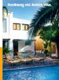
Boothang vid Antimn villa.

Efter de tjugo resoguiderna söker Louis Vuitton nu digitalt med sin app Ambie with Louis Vuitton . Här kan du spara smuttransten i staderna du besöker, ladda ner resoguidar och få tips från stjärnor som Sofia Coppola och Sarah Jessica Parker. Färs gratis i Appstore.