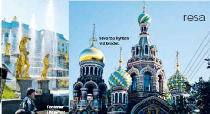
Svordra Kyrkan vid blodet.

Antigen har alla vi som tröttnat på att försöka vika ihop våra citycenter på natt sett blivit benämsda. Det stora sällskapsproblemet genom ett uppmuntrande till stjärn – Campaid ett y map är gjord i ett mjukt, vattentätt material och går alldeles utmärkt att bära styrkita ihop och släppa i boken. Färs för Berlin, Paris, New York och London och kostar cirka 300 kronor på Haystack.se