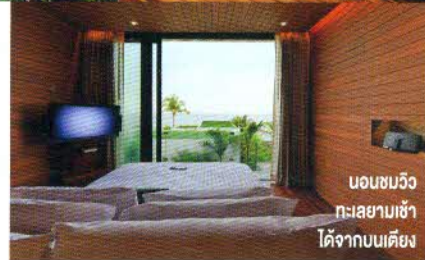
นอนชมวิวทะเลสบายๆ ได้จากบนเตียง

จากโรงแรม ฉันเดินทางด้วยสปีดโบ๊ทประมาณชั่วโมงกว่าๆ ก็ได้มาเดินลัดเลาะเหยียบทรายขาวราวแป้งและแช่กายในน้ำทะเลใสแจ๋วของเกาะตาชัย หนึ่งในเกาะที่สวยงามและพลาดไม่ได้เมื่อคุณเดินทางมาที่พังงา กระนั้นฉันก็ยังไม่วางใจ เมื่อกลับถึงโรงแรมได้จึงออกมาดูตูดว่าอยู่ที่สระว่ายน้ำขนาดใหญ่กลางโรงแรมอีกที แช่น้ำเย็นใสแจ๋ว เกาะขอบสระมองพระอาทิตย์ตกริมทะเลแค่นั้นก็สุขเหลือเฟือแล้วจริงๆ ปิดท้ายกิจกรรมทั้งหลายด้วยการ