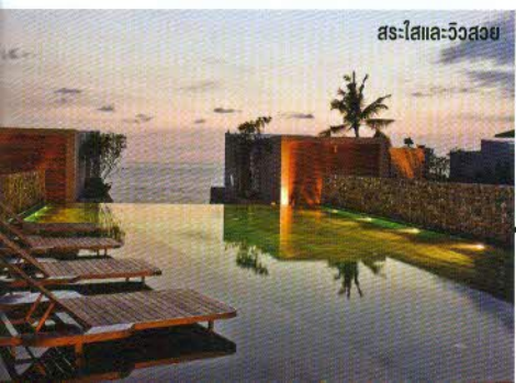
as-สโกลา-วิวสวย

และกระจก ห้องรับแขกด้านล่างมีโซฟาขนาดใหญ่พร้อมหมอนอิงนุ่มนิ่มน่าสบายย้วยวนให้เอนกายลงเสียเหลือเกิน มองเลยผนังกระจกไปยังด้านนอกก็จะพบกับสระสวนตัวที่ชวนให้หย่อนตัวลงไปสัมผัสความผ่อนคลายภายใต้ผิวน้ำใสแจ๋ว ชั้นบนเป็นเตียงนอนหนานุ่มดั่งลีลาชีสที่ปลายเตียงเป็นผนังกระจกใสให้คุณชมทิวทัศน์ของทะเลในยามเช้าได้ทันทีที่ลืมตา (เตียงที่นี้นอนสบายขนาดฉันซึ่งเป็นคนนอนไม่ค่อยหลับเมื่อแปลกที่ ยิ่งหลับสนิทได้เต็มอิ่มตั้งแต่สี่ทุ่มถึงแปดโมงเช้า!!!) อีกหนึ่งอย่างที่ทำให้ฉันไม่อยากจากห้องไปไหนคือสมาร์ททีวีขนาดใหญ่ที่มีอยู่ทั้งในห้องรับแขกและห้องนอน เครื่องเด้งทั้งดูรายการโทรทัศน์และเป็นจอคอมพิวเตอร์ให้ได้ใกล้ชิดชีวิตออนไลน์อย่างสบายตลอดเวลาด้วยดีเลย์บรอดแบนไร้สาย นอกจากนี้ยังมีแคตตาล็อกภาพยนตร์และอัลบั้มเพลงหลากหลายให้ได้เลือกฟังตามรสนิยม ฉันมีหน้าที่แคตเลือกสิ่งที่ต้องการจากรีโมทเท่านั้นพอ